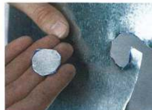
...weniger vieleckiges Arbeitsergebnis. Keine wirklich überzeugende Lösung!