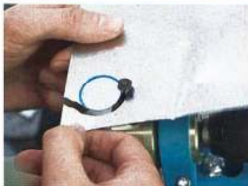
...Kreises aus einer Blechtafel. Auch hier ist der sehr breite „Schnitt“ gut zu sehen