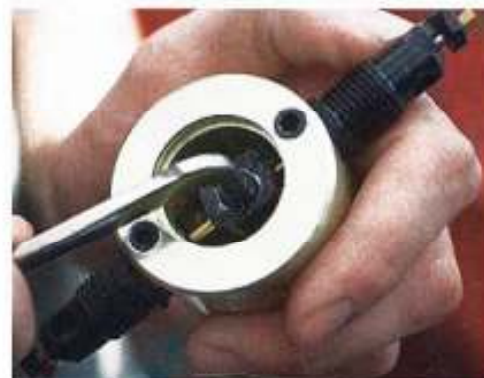
Kein Wegwerfartikel: Der Bohrmaschinenvorsatz lässt sich mit dem mitgelieferten Werkzeug...