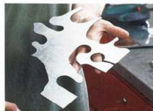
Je kurvenreicher, desto lieber: Mit dem Nibbler sind auch ausgefallene Reparaturbleche keine Hürde

zeug verkantet, außerdem einfache Werkzeuge, um den Nibbler zu zerlegen. Nicht dabei: die auf den Bildern zu sehenden blauen Klemmen für den „stationären Einsatz“ an der Werkbank. Sie kosten 20 Euro extra. Der Vollständigkeit halber: Für 83,10 Euro gibt es bei der Hamburger Firma Dinosaurier Werkzeuge ein augenscheinlich ganz ähnlich konstruiertes Werkzeug für die Bohrmaschine namens Roundcut .