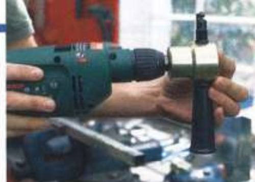
Einsatzbereit: Werkzeug ins Bohrfutter einspannen, Haltegriff festdrehen – und los geht's