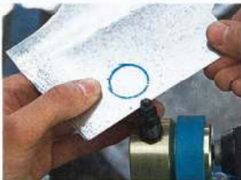
Noch die leichteste Aufgabe für das Nibbler Schneidegerät: das Ausstanzen eines...