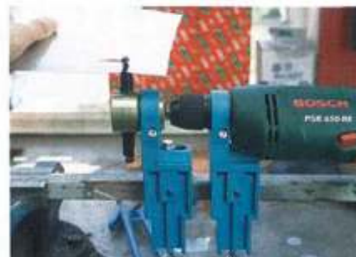
In stationärem Einsatz: Mit zwei einfachen Haltern lässt sich die Bohrmaschine zuverlässig fixieren