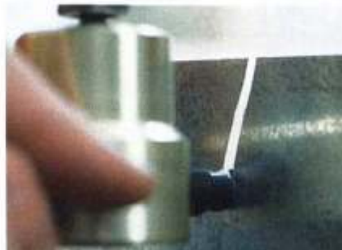
Deutlich zu erkennen: Die Bresche, die die Stanze schlägt, ist viel breiter als ein normaler Schnitt!