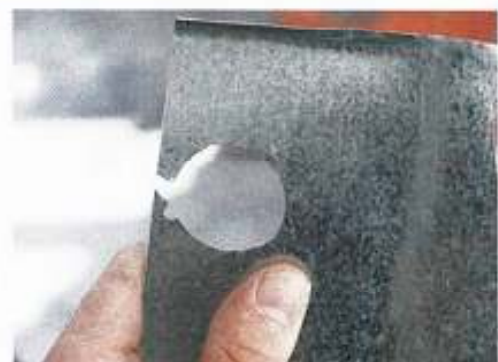
Überzeugend: Mit ein wenig Übung ist auch ein perfektes, kreisrundes Loch möglich

Anfänger nur die Tatsache, dass die Stanznaht naturgemäß viel breiter ausfällt als beispielsweise der Schnitt eines Sägeblatts, was man beim Führen des Werkzeugs berücksichtigen muss.