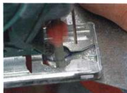
...sie passen, wenn es allerdings um weite Bögen geht, lässt sich mit ihr präzise arbeiten. Auch...