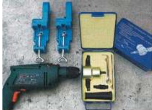
Zusammen mit den Werkbankhaltern 99 Euro teuer: das Nibbler-Set der Firma Gütlich