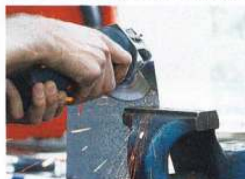
...„fahren“, muss ein ziemlich unerschrockener Optimist sein. Mehr als gerade Schnitte sind in...