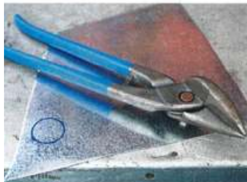
Die Aufgabe: einen kleinen Kreis aus einem Stück Blech schneiden: Wer dies mit einer einfachen...