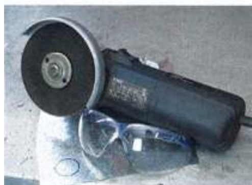
Ein Winkel-, kein Kurvenschleifer: Wer versucht, mit der Flex im Blech eine enge Kurve zu...