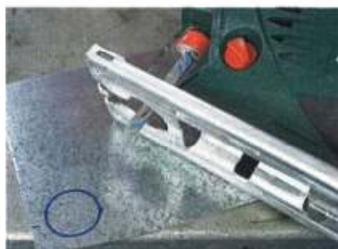
Konkurrent Nummer drei: die Stichsäge mit Metallsägeblatt. Bei engeren Radien muss auch...