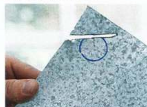
...der Praxis nicht drin – und wer möchte beispielsweise schon ein viereckiges Antennenloch?