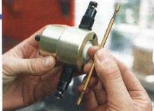
Rechts im Bild: das eigentliche Stanzwerkzeug. Die schwarzen Führungsköpfe sind geschraubt