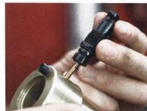
...einfach zerlegen, die wenigen Verschleißteile gibt es auch einzeln und zu fairen Preisen