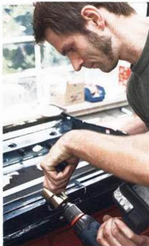
Härtestest: Auch mit einem Akkuschrauber als Antrieb frisst sich der Nibbler durch den Türkasten

Gut gefallen am getesteten Blechnibbler von Gütlich hat uns nicht nur der einfache Umgang mit ihm, sondern auch die Tatsache, dass Verschleißteile wie das Stanzwerkzeug selbst oder sein Führungskopf auch einzeln zu bekommen sind. Im Lieferumfang des 79 Euro teuren Sets sind sogar bereits eine zweite „Stanznadel“ und zweimal Ersatz für den Führungskopf beigelegt, der brechen kann, wenn man das Werk-