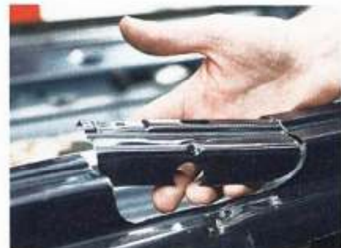
Versuchen Sie das mal mit Flex oder Stichsäge: Das einfache Werkzeug ermöglicht präzise Arbeit