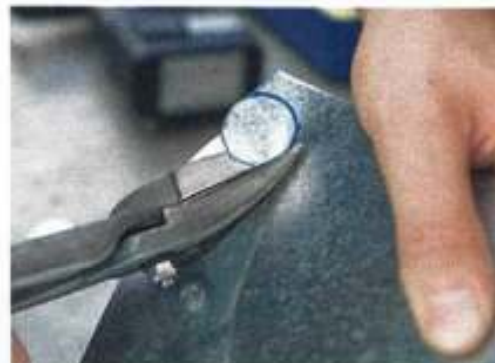
...Blechscherer probiert, verblegt das Blech und produziert letztlich je nach Übung ein mehr oder...