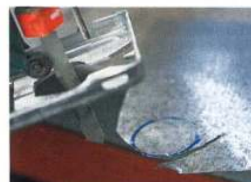
...unseren Musterkreis bekommt sie noch beinahe zufriedenstellend hin